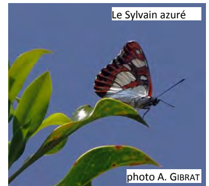
Le Sylvain azuré