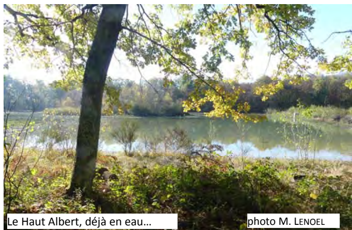
Le Haut Albert, déjà en eau...