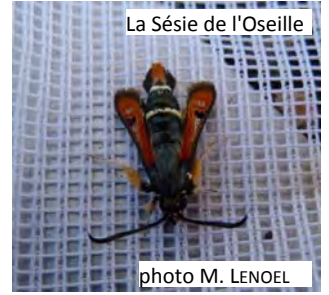
La Sésie de l'Oseille